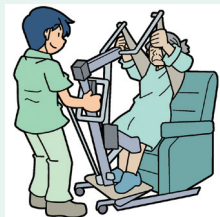
スタンディングマシーンなど