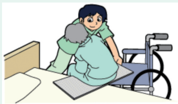
スライディングボード、シートなど