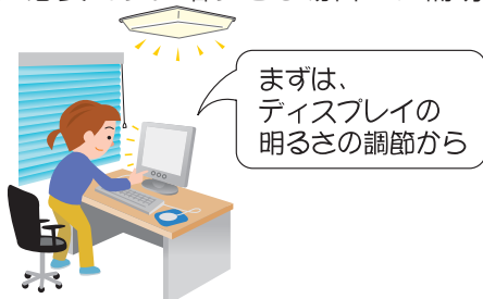
室内照明と部屋に入ってくる光の量の調節