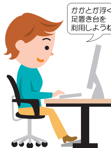
適切な椅子と机の使用