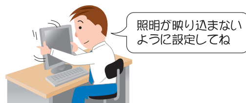
画面の向きや角度の調節