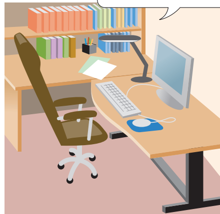
整理された作業スペース