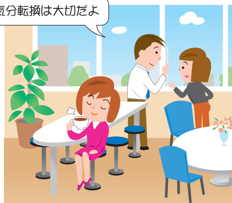
人が集まれる環境づくり