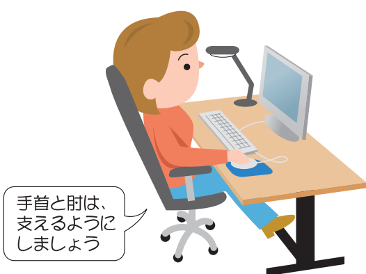
マウスとキーボードの適切な配置