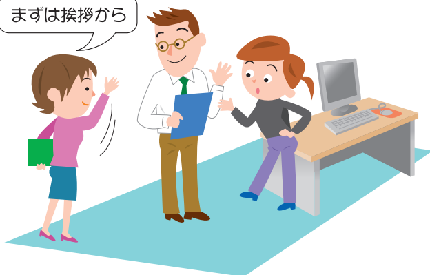
同僚や上司との会話