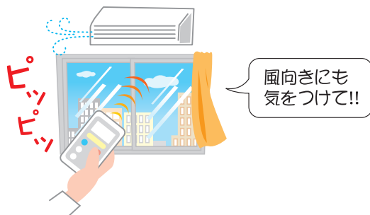
適切な温度へのエアコンの調節