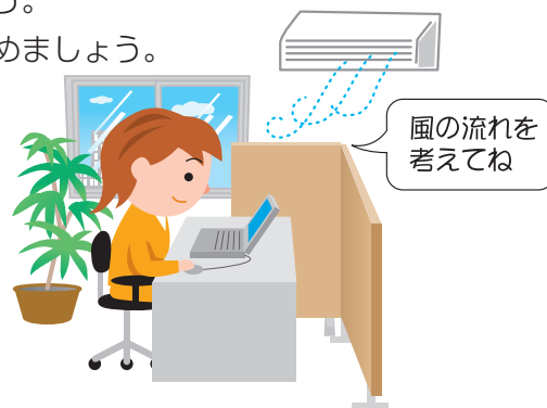
パーティションによる風の遮断