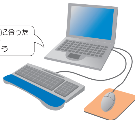
外付けキーボードとマウスの使用